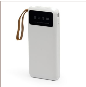
Power Bank 10.000mAh Cod. 08014

10un.....R$ 40,50 cada 50un.....R$ 35,50 cada 100un.....R$ 33,00 cada