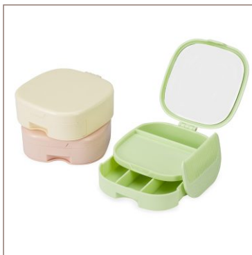
Porta-Joias com Espelho Cod. 18984

10un.....R$ 32,50 cada 50un.....R$ 28,00 cada 100un.....R$ 26,50 cada