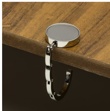
Porta Bolsa de Metal Dobrável Cod. 10006

10un.....R$ 50,00 cada 50un.....R$ 43,50 cada 100un.....R$ 41,00 cada