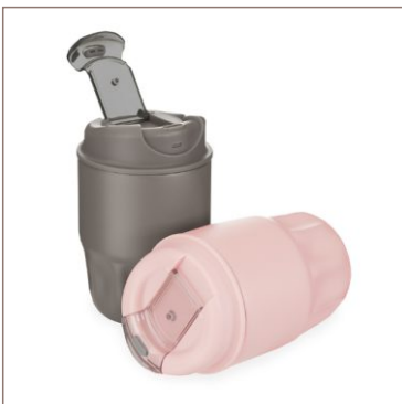
Kit Copo Térmico 250ml Cod. 09127

10un.....R$ 12,50 cada 50un.....R$ 10,00 cada 100un.....R$ 8,60 cada