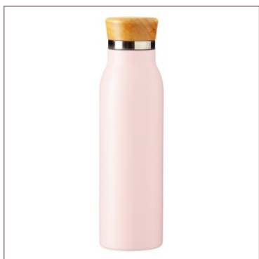
Garrafa Térmica 600ml Cod. 19072

10un.....R$ 52,50 cada 50un.....R$ 45,00 cada 100un.....R$ 43,00 cada