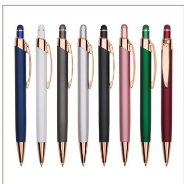
Caneta Metal Touch Cod. 06076T

10un.....R$ 17,50 cada 50un.....R$ 14,00 cada 100un.....R$ 12,00 cada