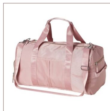
Bolsa Esportiva 36L Cod. 04085

10un.....R$ 37,50 cada 50un.....R$ 34,50 cada 100un.....R$ 31,50 cada