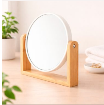
Espelho de Mesa Bambu Cod. 19100

10un.....R$ 18,50 cada 50un.....R$ 14,50 cada 100un.....R$ 13,50 cada