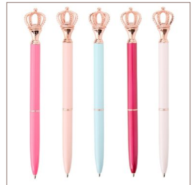
Caneta Metal Coroa Cod. 08174

10un.....R$ 39,50 cada 50un.....R$ 35,00 cada 100un.....R$ 32,00 cada