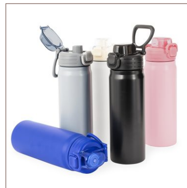
Garrafa Térmica 680ml Cod. 19065

10un.....R$ 22,50 cada 50un.....R$ 19,50 cada 100un.....R$ 18,00 cada