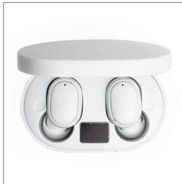
Fone de Ouvido Bluetooth Cod. 08120

10un.....R$ 98,80 cada 50un.....R$ 88,50 cada 100un.....R$ 85,50 cada