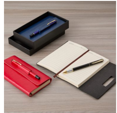
Kit para Anotações Cod. 07050

10un.....R$ 26,50 cada 50un.....R$ 23,00 cada 100un.....R$ 21,50 cada