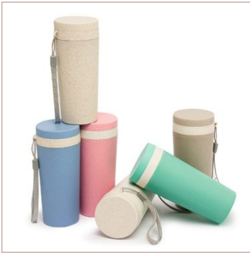
Copo Fibra de Bambu 350ml Cod. 03006

10un.....R$ 18,50 cada 50un.....R$ 14,50 cada 100un.....R$ 13,50 cada