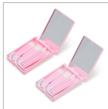
Kit Pincel 5 Peças Cod. 18874-ROS/MIS

10un.....R$ 29,00 cada 50un.....R$ 25,50 cada 100un.....R$ 22,00 cada