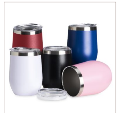
Copo Térmico Inox 320ml Cod. 14726L

10un.....R$ 19,00 cada 50un.....R$ 15,00 cada 100un.....R$ 13,00 cada