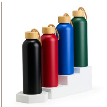
Garrafa de Alumínio 800ml Cod. 18940

10un.....R$ 32,50 cada 50un.....R$ 28,00 cada 100un.....R$ 26,50 cada