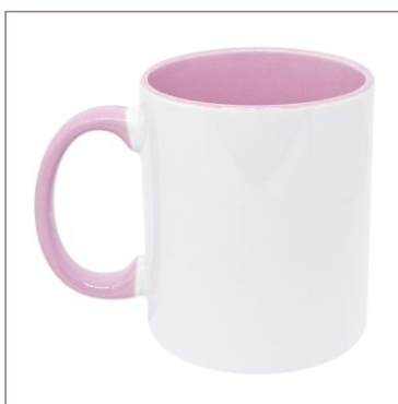
Caneca de Porcelana

10un.....R$ 9,00 cada 50un.....R$ 7,50 cada 100un.....R$ 6,45 cada